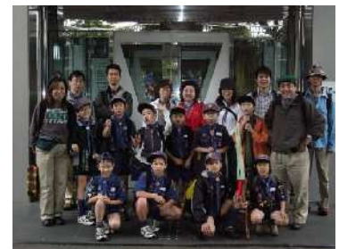
防災館前で記念撮影