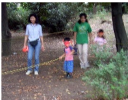
目隠ししてソロソロと(暗夜航路)

4回目の「一日アウトドア体験」親子で暗夜航路、バブロケット、ダンスダンス、水鉄砲的当て、を楽しんでもらいました。