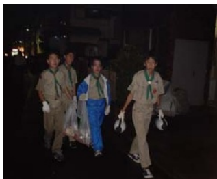
9/7 祭礼奉仕(ごみ拾い)