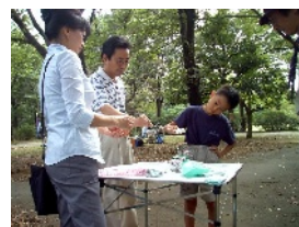
大好評! (おやつのマシュマロ)

4回目の「一日アウトドア体験」親子で暗夜航路、バブロケット、ダンスダンス、水鉄砲的当て、を楽しんでもらいました。