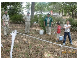
水鉄砲で的をねらえ