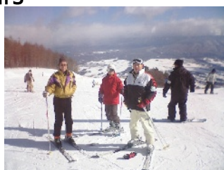
春スキーのような 暖かな晴天でした

今後の予定 2/13 GB 会議及びブスカウト訓練・リーダー会議 2月隊集會を2/27から 3/13(日)に変更