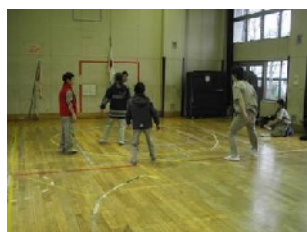
3名の新しい仲間と元気に 3on3