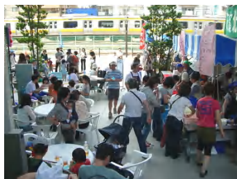
開会式は都立農芸高校の皆さんの和太鼓ではじまりました