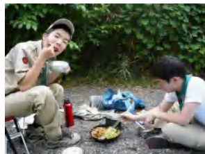
“ うまい! ”