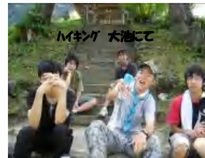
ハイキング 大池にて