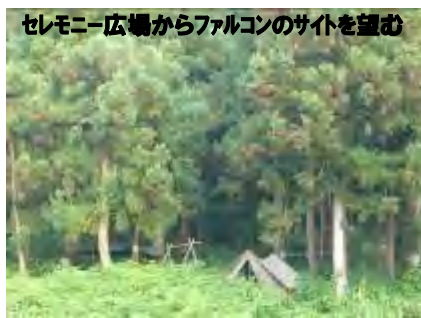
セレモニー広場からファルコンのサイトを望む