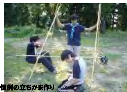
慣例の立ちかま作り