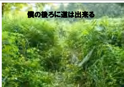
僕の後ろに道は出来る