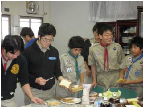
ワイワイとサンドウィッチ作り