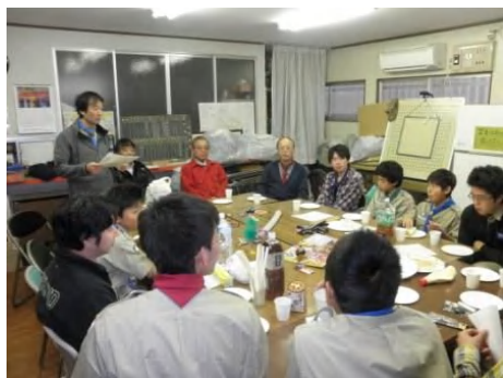
ドキドキの成績発表