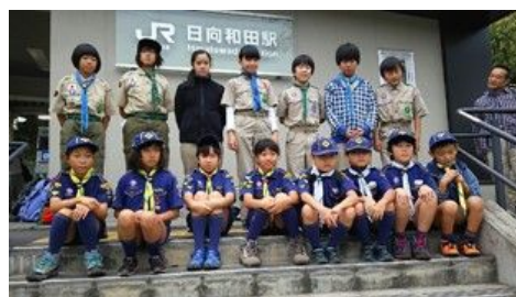
ゴールノ日和田駅にて