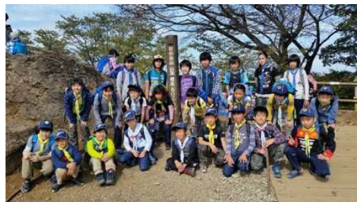
日の出山 山頂にて