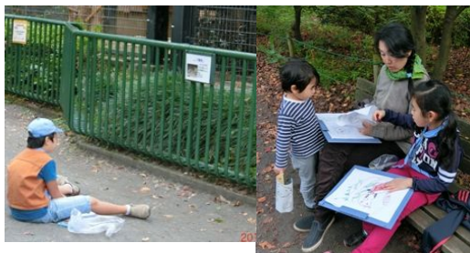
スケッチした動物を発表しました