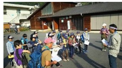
古里駅から地図をたよりにスタート