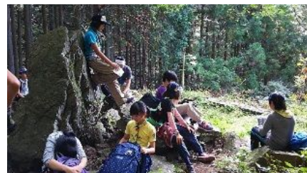
小 休 止