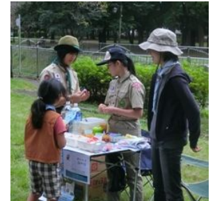
最後のポイントはお菓子！