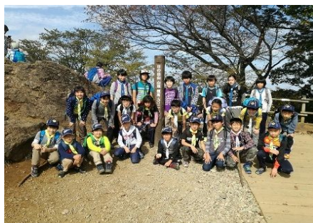
スカウト全員集合

多くの行程が下りではあったものの長距離を歩いたしか、うさぎスカウトもさることながら、登りを含めた全行程を徒歩で完遂した月の輪スカウトたちはさすがに疲れはしていたものの、ボーイ隊への上進に向け十分な力を発揮し、各自自信にもなったようでした。