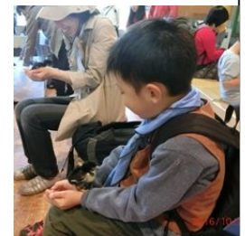
モルモットやひよこを優しくだっこ