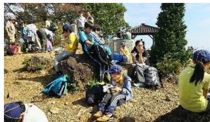
山 頂 で お 弁 当