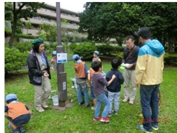
いつも人気のバブロケット