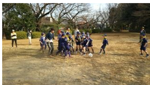
サイコロサッカー大会