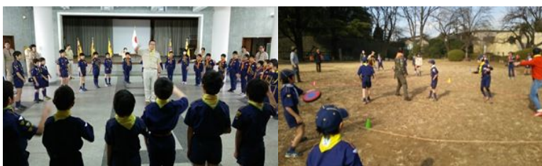
カブジャンボリー全体セレモニー