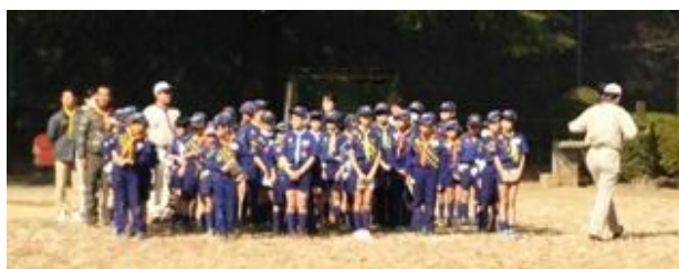
カブジャンボリースポーツ大会

閉会セレモニーではスポーツ大会の表彰とカブジャンボリー本番に向けての話をして終了しました。