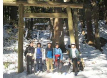
大岳山荘で2班合流