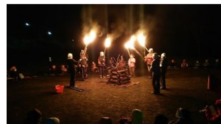
カブジャンボリー キャンプファイヤー