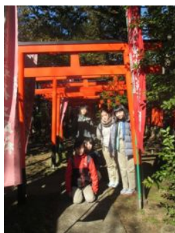
東伏見稲荷の鳥居