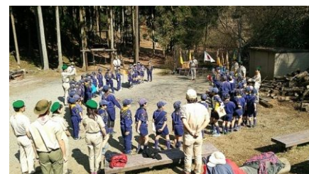
カブジャンボリー 合同セレモニー

最後に全体での表彰と閉会セレモニーを実施し解散、各団のスカウトとも別れを惜しみながら現地を後にしました。