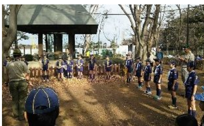
スケート合同セレモニー

スケートのあと再度公園に移動し、みんなでカブ弁を食べ、しっぽ取りのゲームをし他団のスカウトとも打ち解けることができました。