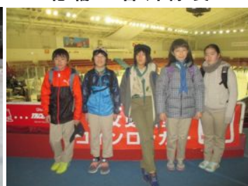
2時間滑走で疲れた