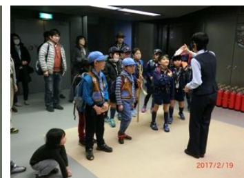
スカイツリーを見ながら防災館へ