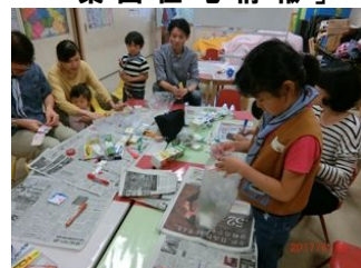
工 作 中

ビーバー隊 7月の活動予定 2日(日)「工作・ゲーム」 荻窪児童館 16日(日)「川遊び」 野川公園 30日(日)「夏キャンプ安全祈願&出発式」 白山神社