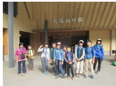
高尾山口駅、意外と元気