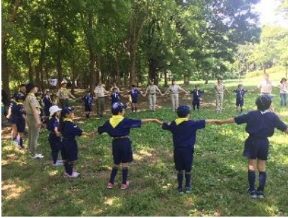
ビーバー合同セレモニー