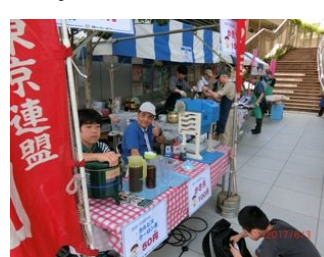
かき氷 & ドリンク