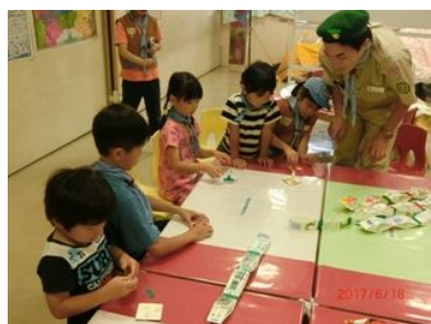
ジャンプへびとくるくるコマが出来ました