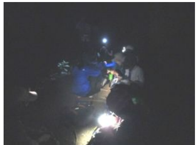
地図のチェック、記録