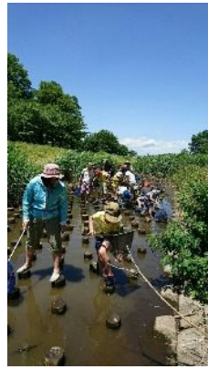
みんなでガサガサ