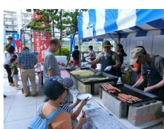
焼きそば&フランク