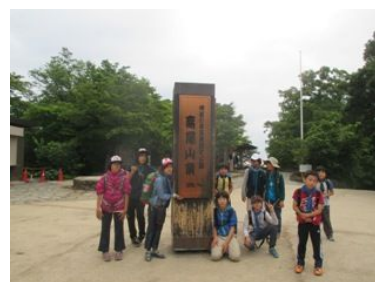
やっと到着、高尾山山頂

23：30 陣馬山山頂：略予定通りに陣馬山山頂に到着。全員まだまだ元気で快調に進んだ。山頂では休憩 10 分のみで早速下山開始となった。