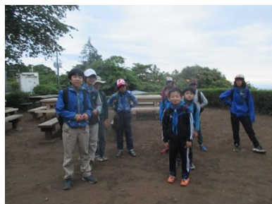
夜明けの出発、小仏城山