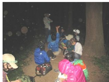
景信山山頂直前の休憩