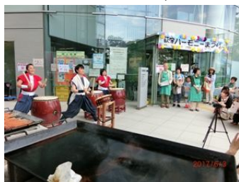
オープニング太鼓

本年も梅雨の時期恒例の「荻窪ハーモニーまつり奉仕」に参加しました。 当日の天候は晴れ時々曇り空となり、スカウトは、ヨーヨー釣りコーナーで「こより」を作ったり、風船をふくらませたり、大きな声で呼びかけしたり、元気にお手伝いをすることが出来ました。