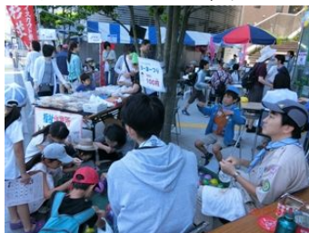
ヨーヨーコーナー