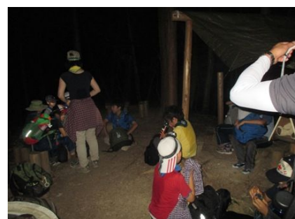
陣馬山頂あと1kmの休憩