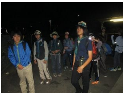
藤野駅出発前の整列

21:55 陣馬山登山口：一般道路が終わりいよいよ登山道が始まる。30分きつい登りが続き、涼しいにも拘わらず汗をかき始める。その後一時間程登りが続き、全員快調なペースで進んだ。