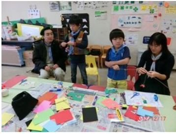
クリスマスモビール作り

今年も楽しいクリスマスの季節がやってきました。セレモニー後の工作プログラムでは、「クリスマスモビール」作りに挑戦、色画用紙に好きな絵を描いて→切り取り→タコ糸で竹ひごにぶら下げ→バランスを調整→ステキな作品が完成しました。