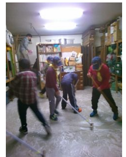
床ブラッシング中

12/17(日) 「野外料理：ほうとう作り」 8時~16時 野川公園 晴れ 風強し