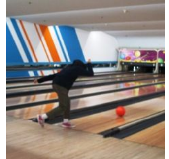
鈴木 明らかに violation