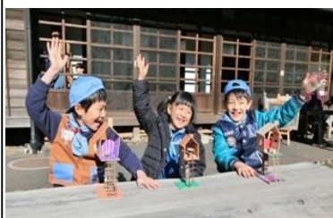
星と森と絵本の家で木工作