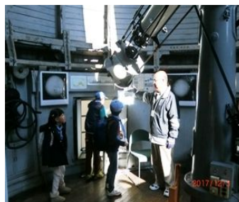
太陽観測について説明してもらいました。