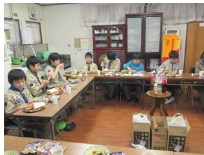
食 事 中